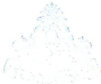
(นางบงอร บุตรมะรภัย) หัวหน้าเจ้าหน้าที่พัสดุ